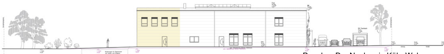
Bauplan: Der Neubau in Köln-Wahn